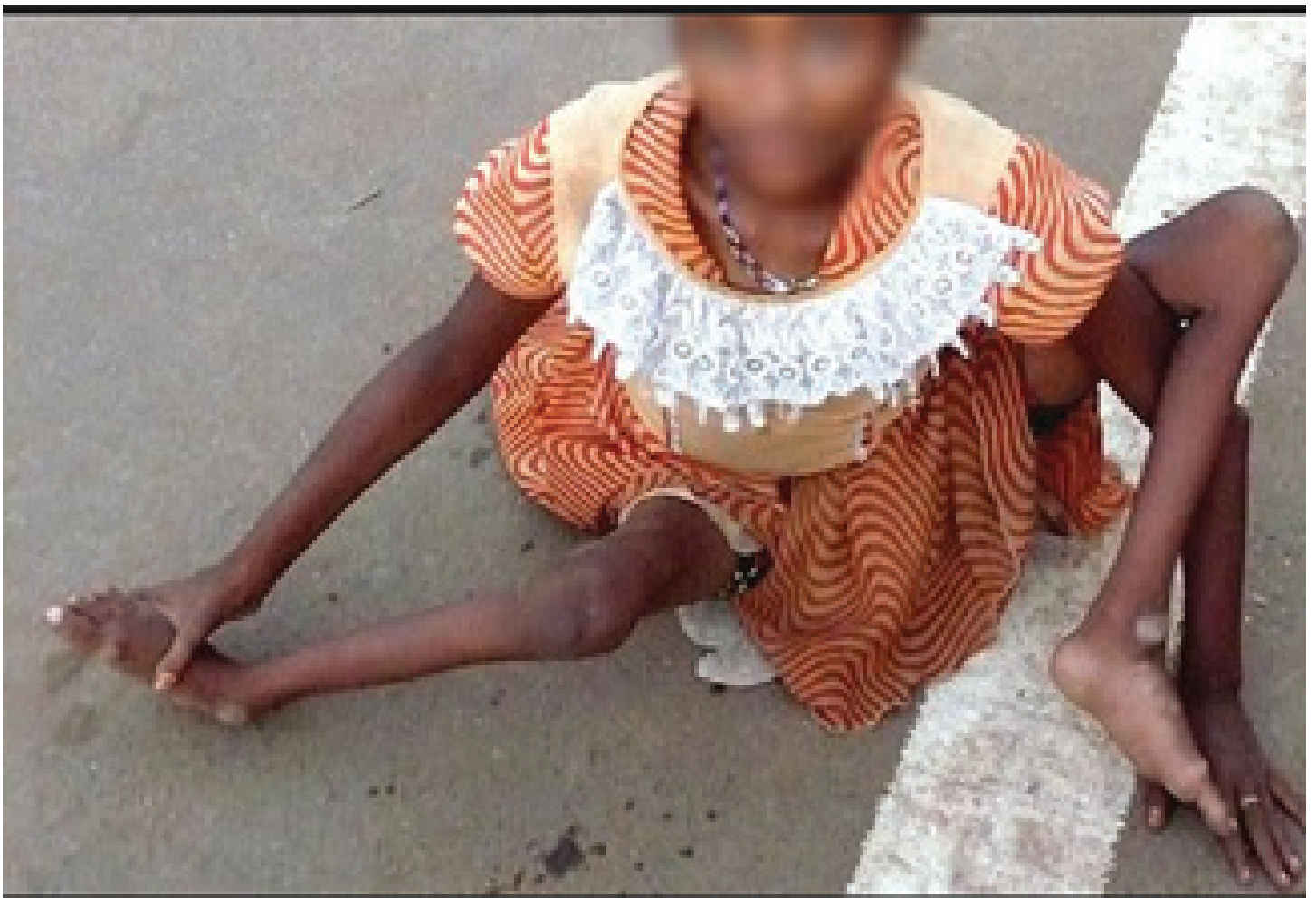
Uma vítima do poliovírus.

“Comparado com as ações a serem realizadas, é a organização da resposta, a sensibilização da comunidade com a busca sistemática de crianças em dose zero. Isso permitirá a recuperação de todas as crianças que escapam da vacinação de rotina”.