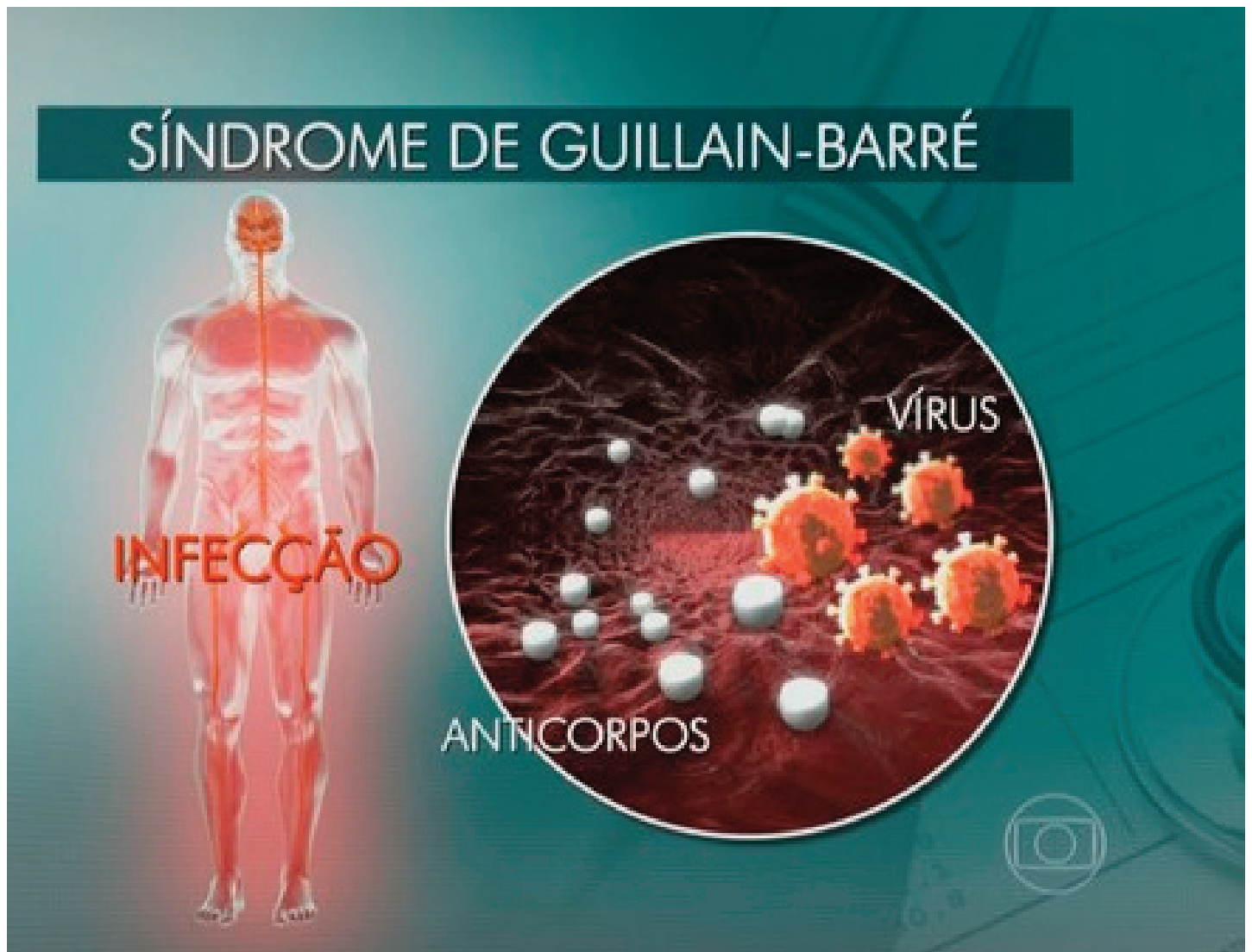
Imagem de ilustração sobre a síndrome de Guillain Barré

A emergência abrange as 25 regiões do país.