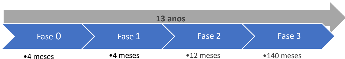
Figura 1 – Cronograma Geral da Concessão

também a expansão da rede de acordo com diretrizes definidas pelo PODER CONCEDENTE. Nesta fase também é esperado que a CONCESSIONÁRIA substitua todos os pontos com luminárias LED Solar Integrada.